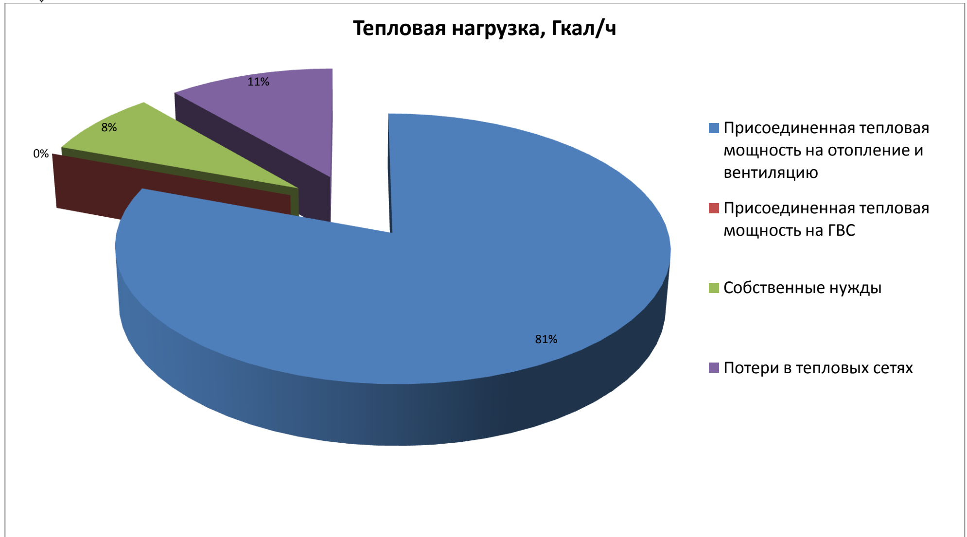
Рис. 1.4. Структура выработки тепловой энергии Котельной БК