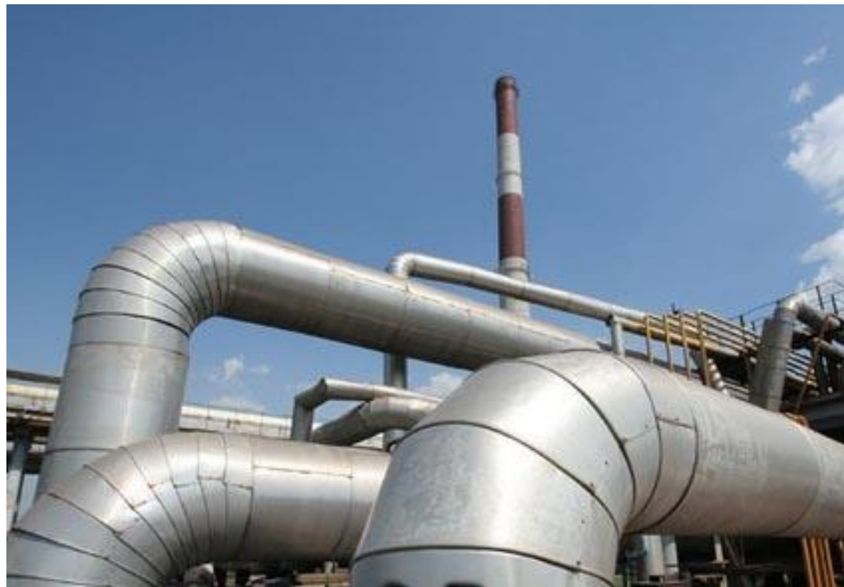
Схема теплоснабжения сельского поселения «село Совхоз Победа» до 2028 года

248002 г. Калуга, улица Ф. Энгельса, дом 145, оф. 9 Телефон: +7 (910) 910-36-43