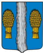
Схема теплоснабжения сельского поселения «село Совхоз Победа » до 2028 года

В настоящее время предприятие ООО «МТС» отвечает всем требованиям критериев по определению единой теплоснабжающей организации, а именно: